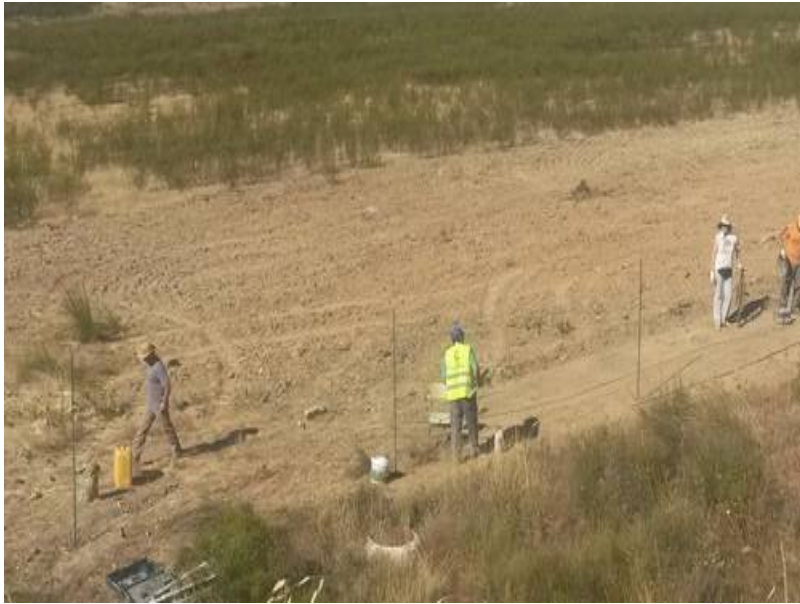
( http://www.elgranado.es/export/sites/elgranado/es/.galleries/imagenes-noticias/Noticias-2014/julio/e9c236e453.jpg )