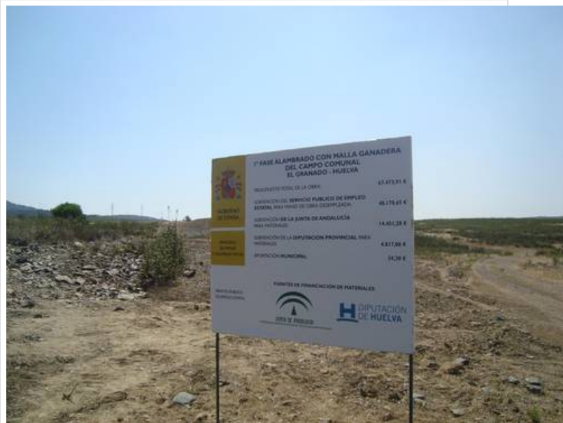
( http://www.elgranado.es/export/sites/elgranado/es/.galleries/imagenes-noticias/Noticias-2014/julio/2a65f413da.jpg )