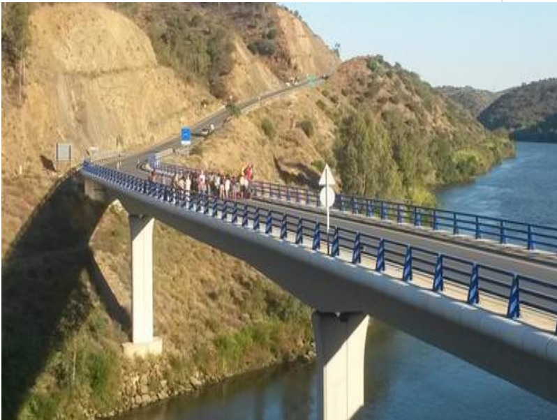
( http://www.elgranado.es/export/sites/elgranado/es/.galleries/imagenes-noticias/Noticias-2014/julio/61c26f174a.jpg )