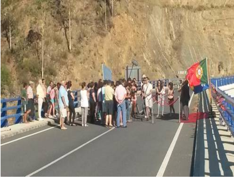
( http://www.elgranado.es/export/sites/elgranado/es/.galleries/imagenes-noticias/Noticias-2014/julio/e437d78958.jpg )