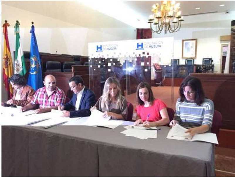
( http://www.elgranado.es/export/sites/elgranado/es/.galleries/imagenes-noticias/Noticias-2015/octubre/39c65b044a.jpg )