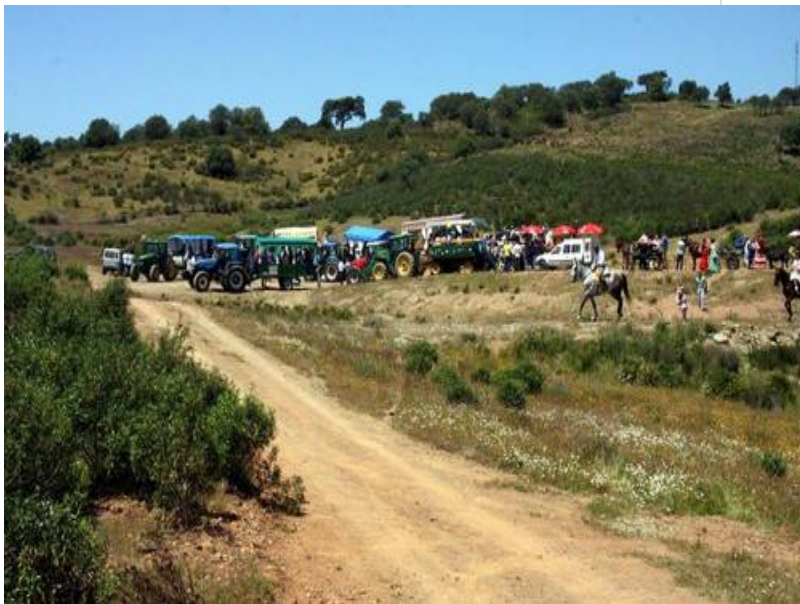
( http://www.elgranado.es/export/sites/elgranado/es/.galleries/imagenes-noticias/Noticias-2016/mayo/65b62acf16.jpg )