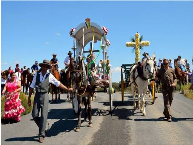
( http://www.elgranado.es/export/sites/elgranado/es/.galleries/imagenes-noticias/Noticias-2016/mayo/662ecff3db.jpg )