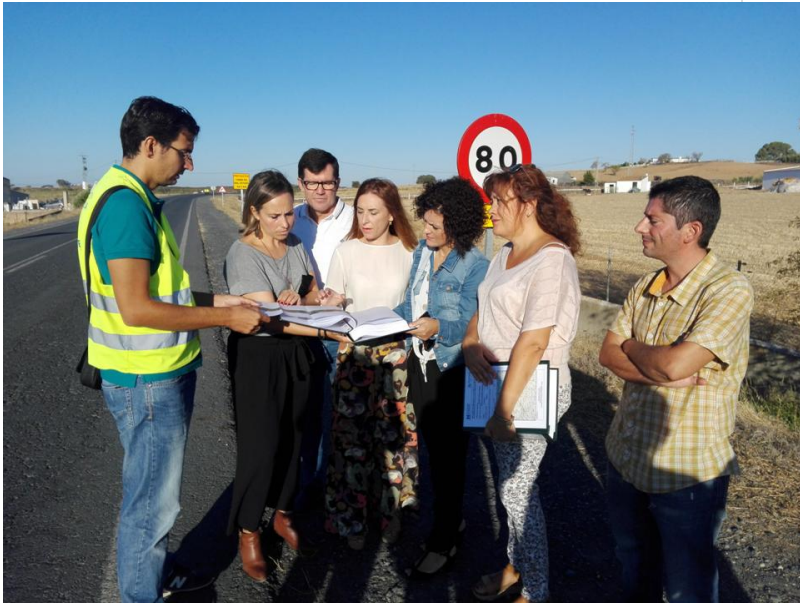
( http://www.elgranado.es/export/sites/elgranado/es/.galleries/imagenes-noticias/Noticias-2015/septiembre/Diapositiva2.JPG )