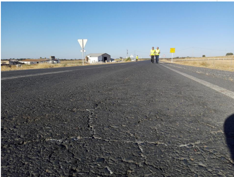
( http://www.elgranado.es/export/sites/elgranado/es/.galleries/imagenes-noticias/Noticias-2015/septiembre/Diapositiva3.JPG )