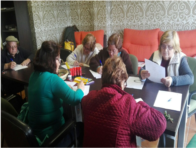
( http://www.elgranado.es/export/sites/elgranado/es/.galleries/imagenes-noticias/Noticias-2016/grupo-2.jpg )