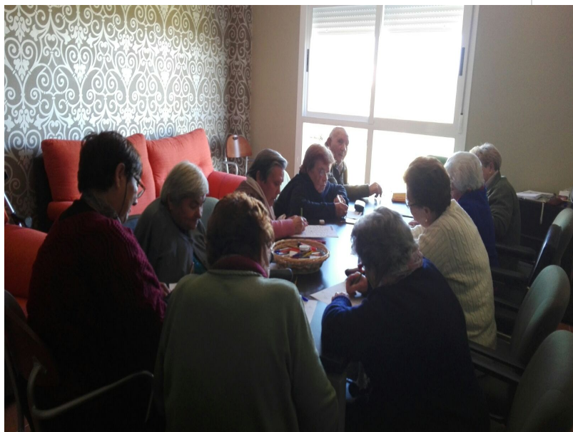
( http://www.elgranado.es/export/sites/elgranado/es/.galleries/imagenes-noticias/Noticias-2016/grupo-1.jpg )